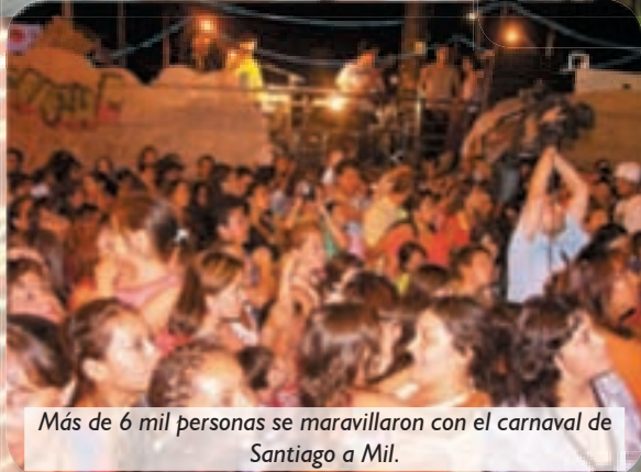
Más de 6 mil personas se maravillaron con el carnaval de Santiago a Mil.