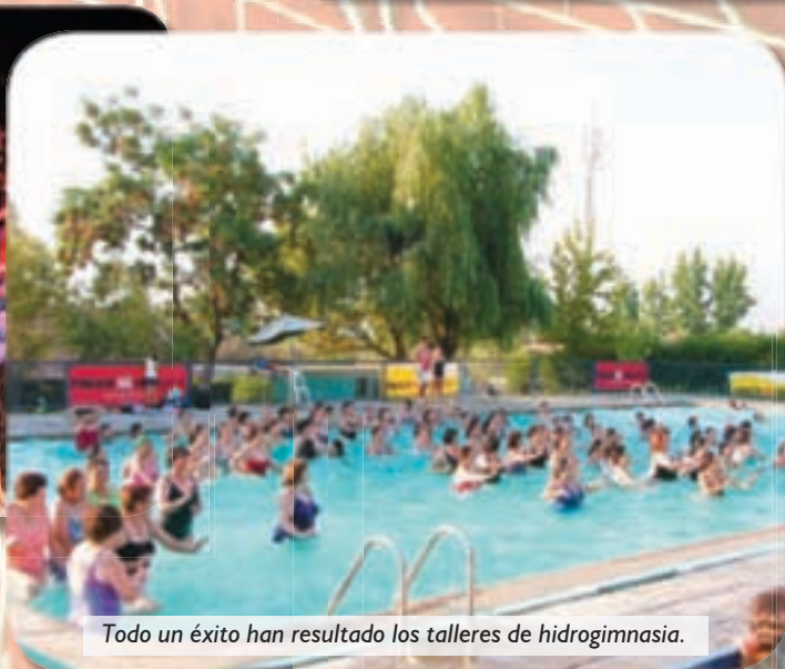
Todo un éxito han resultado los talleres de hidrogimnasia.