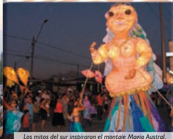
Los mitos del sur inspiraron el montaje Magia Austral.