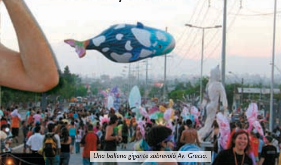
Una ballena gigante sobrevoló Av. Grecia.