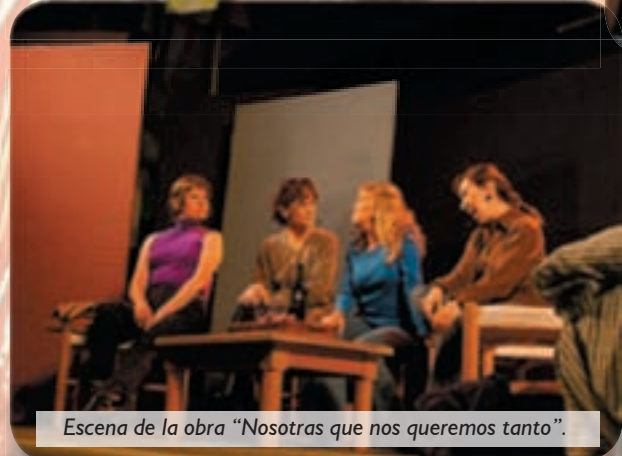
Escena de la obra "Nosotras que nos queremos tanto".